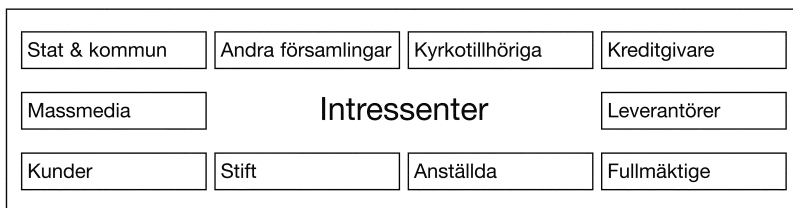
Figur 1: Årsredovisningens intressenter

Årsredovisningen har en viktig roll att bidra till att intressenter kan få information om hur kyrkoavgiften och andra medel används i verksamheten.